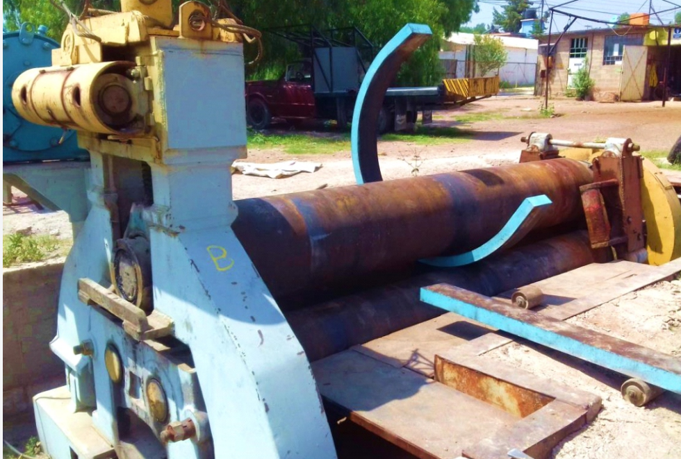
Rolado de placa de acero SAE 4140 EN ESP. DE 3 PULGADAS